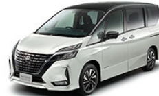
セレナ e-POWER ハイウェイスターV