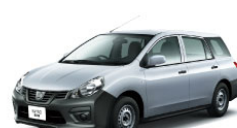
NV150 AD エキスパート GX (2WD)