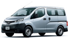
NV200 バネット GX [E-ATx] 2/5 人乗 (2WD)