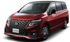
エルグランド 250 ハイウェイスターS (2WD)