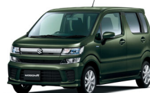
ワゴンR HYBRID FZ