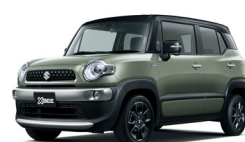
クロスビー HYBRID MZ