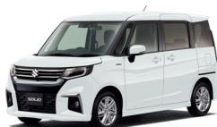
ソリオ HYBRID MZ