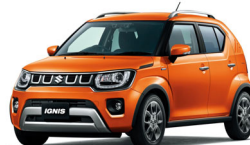
イグニス HYBRID MF