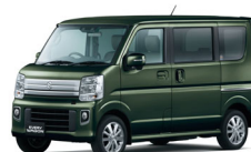
エブリイワゴン PZ ターボスペシャル