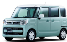
スペーシア HYBRID X