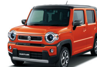
ハスラー HYBRID X