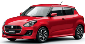
スイフト HYBRID RS